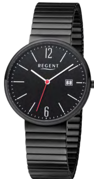
BA-579 Edelstahl IP-black, 3 Bar UVP 99,00 €