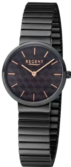
BA-584 Edelstahl IP-black, 3 Bar UVP 99,00 €