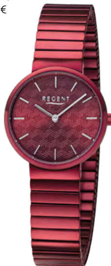
BA-586 Edelstahl IP-red, 3 Bar UVP 99,00 €