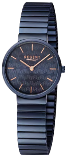
BA-585 Edelstahl IP-blau, 3 Bar UVP 99,00 €