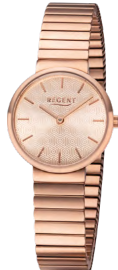
BA-583 Edelstahl IP-rosé, 3 Bar UVP 99,00 €