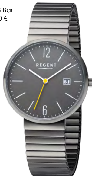
BA-581 Edelstahl IP-gun, 3 Bar UVP 99,00 €