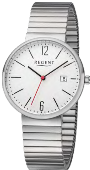
BA-578 Edelstahl, 3 Bar UVP 79,90 €