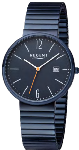
BA-580 Edelstahl IP-blau, 3 Bar UVP 99,00 €