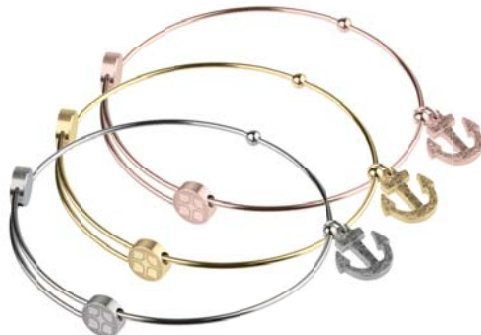
A303 A304 A305 49,00 € 59,00 € 59,00 €

matt/poliert/graviert/gekratzt, Gelb- oder Roségold beschichtet, Ø ca 58 mm / groß ca. 62 mm