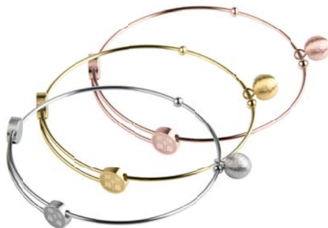
A209 A210 A211 49,00 € 59,00 € 59,00 €

matt/poliert/graviert/gekratzt, Gelb- oder Roségold beschichtet, Ø ca 58 mm / groß ca. 62 mm