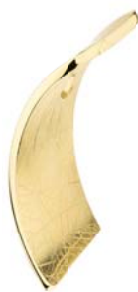
AN866 42,00 €