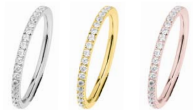
R453.WH 67,00 €