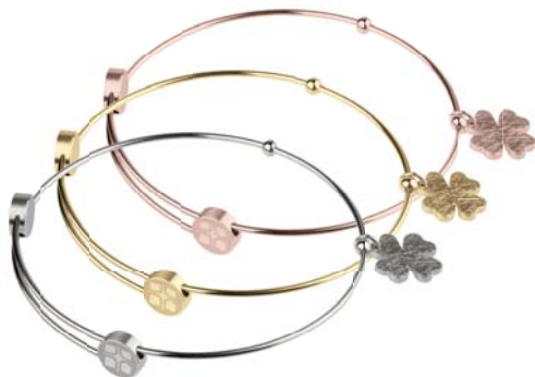
A306 A307 A308 49,00 € 59,00 € 59,00 €

matt/poliert/graviert/gekratzt, Gelb- oder Roségold beschichtet, Ø ca 58 mm / groß ca. 62 mm