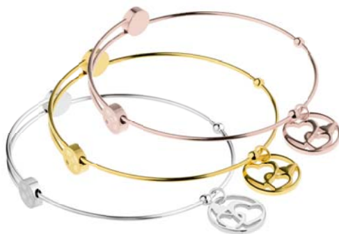
A309 A310 A311 56,00 € 66,00 € 66,00 €

matt/poliert/graviert, Crystal Black Pearl/Crystal White Pearl, Ø ca 58 mm / groß ca. 62 mm