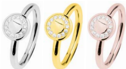
R459.WH 64,00 €

2 mm, poliert, Zirkonia white, Gelb- oder Roségold beschichtet