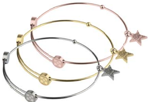
A300 A301 A302 49,00 € 59,00 € 59,00 €

matt/poliert/graviert/gekratzt, Gelb- oder Roségold beschichtet, Ø ca 58 mm / groß ca. 62 mm