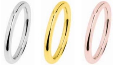
R450 26,00 € R451 43,00 € R452 43,00 €

2 mm, poliert, Gelb- oder Roségold beschichtet