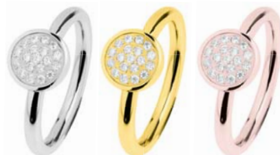
R462.WH 69,00 €

2 mm, poliert, Zirkonia white, Gelb- oder Roségold beschichtet