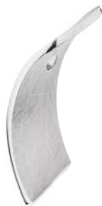
AN865 35,00 €