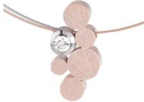
K773 111 € matt/polirt/gekratzt, teilweise Rosé- gold beschichtet, Zirkonia white, Drahtseil 2-fach