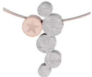
K777 113 € matt/gekratzt/polirt/graviert, teilweise Roségold beschichtet, Drahtseil 2-fach