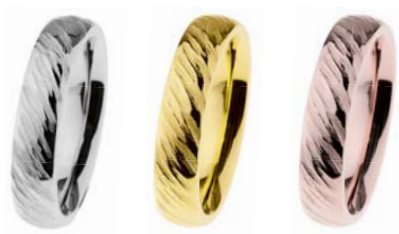
R536 36,00 € R537 52,00 € R538 52,00 €

2 mm, poliert/geschliffen, Gelb- oder Roségold beschichtet