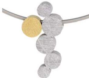
K776 121 € matt/gekratzt, teilweise Gelbgold beschichtet, Spiralseil Ø 1,8 mm