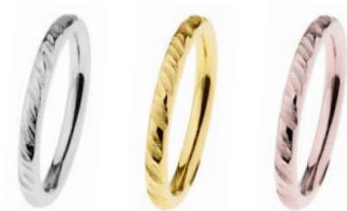
R533 33,00 € R534 49,00 € R535 49,00 €

5 mm, poliert, Gelb- oder Roségold beschichtet