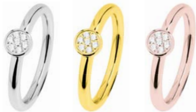
R456.WH 59,00 €

2 mm, poliert, Zirkonia white, Gelb- oder Roségold beschichtet