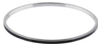
A158.3.BL 45,00 €

poliert, Gelb- oder Roségold beschichtet, Zirkonia white, ca. 3 mm breit, Ø ca 64 mm / groß ca. 67 mm