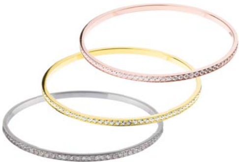
A157.3.WH A159.3.WH A160.3.WH 119,00 € 129,00 € 129,00 €

poliert, Gelb- oder Roségold beschichtet, Zirkonia white, ca. 1,5 mm breit, Ø ca 64 mm / groß ca. 67 mm