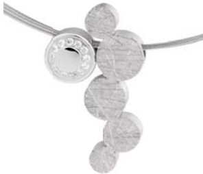
K775 119 € matt/polirt/gekratzt, Zirkonia white, Drahtseil 5-fach