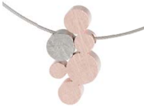
K772 102 € matt/gekratzt, teilweise Roségold beschichtet, Drahtseil Ø 0,63 mm