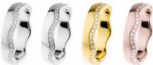
R577 92,00 €