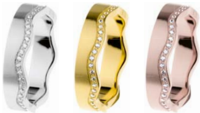
R553 92,00 €