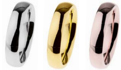
R530 29,00 € R531 45,00 € R532 45,00 €

2 mm, poliert, Gelb- oder Roségold beschichtet