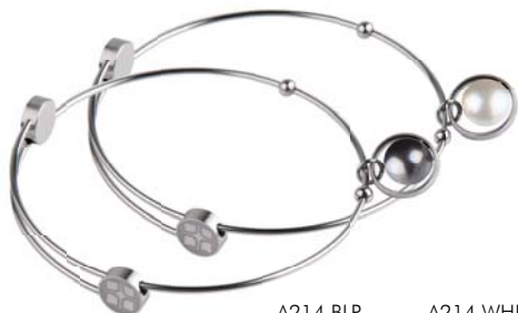
A214.BLP A214.WHP 49,00 € 49,00 €

matt/poliert/graviert, Gelb- oder Roségold beschichtet, Crystal White Pearl, Ø ca 58 mm / groß ca. 62 mm