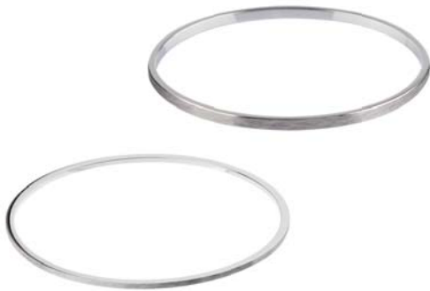
A156.2 A156.3 35,00 € 35,00 €

geschliffen, ca. 1,5 mm oder ca. 3 mm breit, Ø ca 64 mm / groß ca. 67 mm