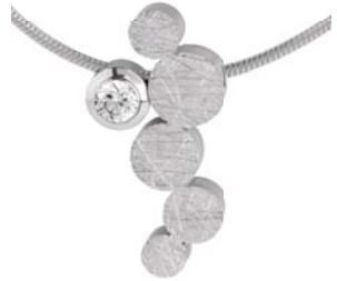
K774 100 € matt/polirt/gekratzt, Zirkonia white, Schlangenkette Ø 1,8 mm