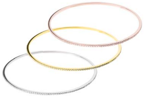
A157.2.WH A159.2.WH A160.2.WH 119,00 € 129,00 € 129,00 €

geschliffen, ca. 1,5 mm oder ca. 3 mm breit, Ø ca 64 mm / groß ca. 67 mm