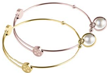
A403.WHP A404.WHP 62,00 € 62,00 €

matt/poliert/graviert, Gelb- oder Roségold beschichtet, Zirkonia white, Ø ca 58 mm / groß ca. 62 mm