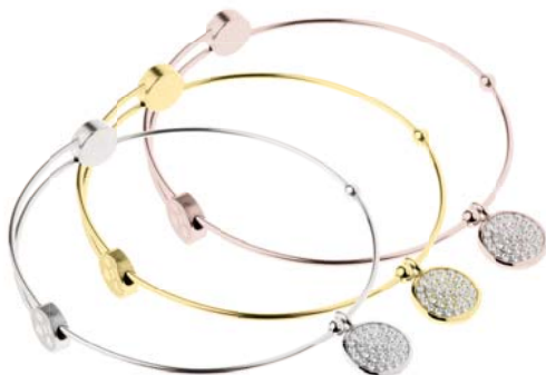
A410.WH A411.WH A412.WH 69,00 € 79,00 € 79,00 €

matt/poliert/graviert, Gelb- oder Roségold beschichtet, Zirkonia white, Ø ca 58 mm / groß ca. 62 mm