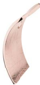
AN867 42,00 €

matt/poliert/gekratzt, Gelb- oder Roségold beschichtet, ca. 5x26 mm