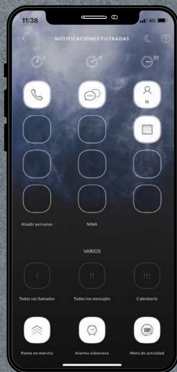
03 Gefilterte Benachrichtigungen