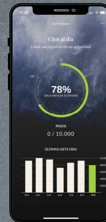
04 Daily Hundred (Schritte)